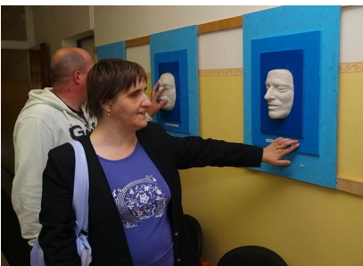
Látogatás a VERCS-en