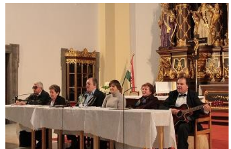
Helen Keller a Szt. Annában