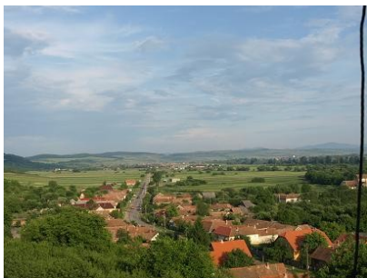
Helen Keller műsor Szilagyóványban