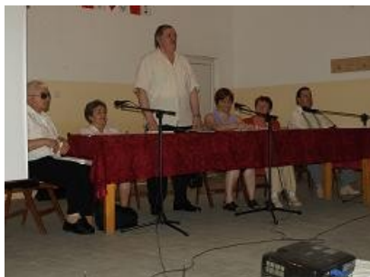
Érzékenyítés a MÚOSZ székházban...