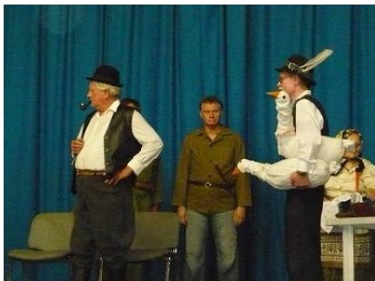
Jelenet a Lúdas Matyiból