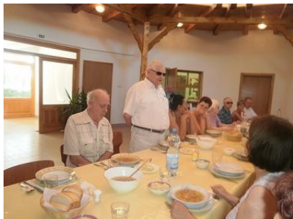
Nyári táborozás Hajdúdorogon