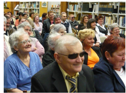
képeken a meghívott vendégek és a közönség láthatóak/