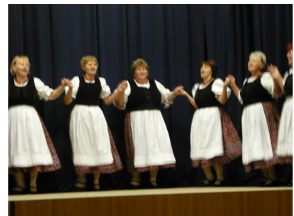
A képeken a Csattogó citerazenekar, a Bocskai Népzenei Együttes, és a Szivárvány Néptáncsoport láthatóak/